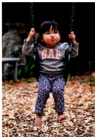
準特選 「だれかおしてよー!」

(講評) 川村美術館内の庭園の静けさに安らぎを覚えます。ハイコントラスト表現で、陽射しで切り取った光景の力強さがあり、得意な流儀です。