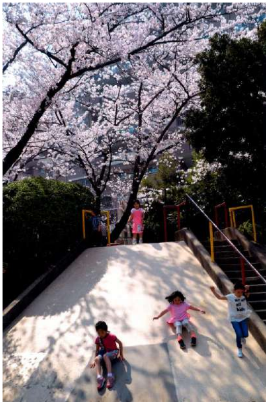
推薦 「桜の下のすべり台」