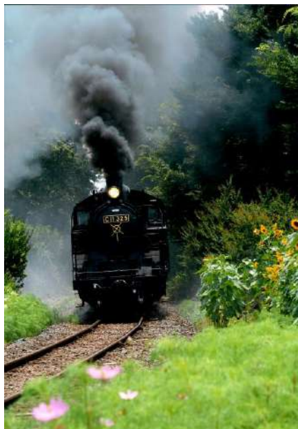
特選 「ひまわりの咲く頃」

(講評) 満開の桜の花が春の陽に照らされて美しい。陽射しは滑り台の幼子供たちにも降り注いで、無邪気な遊び盛りの活動をライトアップしている。木陰がアクセントです。