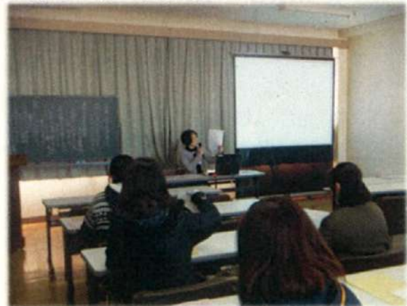
学校でのセミナー実施風景

今後、ご要望があれば、大規模事業所等での制度説明会も実施していきます。 (従業員500名以上の事業所を想定していますが、ある程度の人数で聞いて いただけるようであれば対応いたします) ご要望がありましたら、管轄の年金事務所にご相談ください。