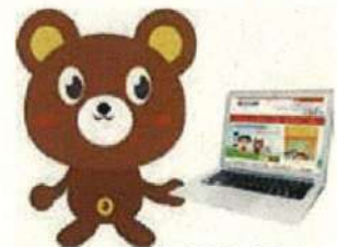
ねんきんクマ 「ねんきんネット」マスコット