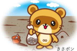
潮干狩り料金表(網なし)