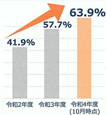
主要な届出 ※1 の電子申請割合

※1 資格取得届・資格喪失届・算定基礎届・ 月額変更届・賞与支払届・被扶養者(異動)届・ 国民年金第3号被保険者関係届