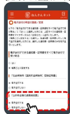
【ステップ 2 の画面イメージ】

https://www.keisan.nta.go.jp/kyoutu/ky/smsp/top#bsctrl