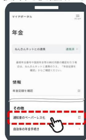
【ステップ 1 ③の画面イメージ】