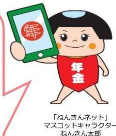
「ねんきんネット」 マスコットキャラクター ねんきん太郎